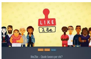
like2be – Quale lavoro per chi? Ciclo 3