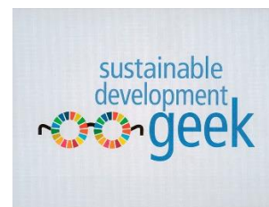
Sustainable development geek Secondario II