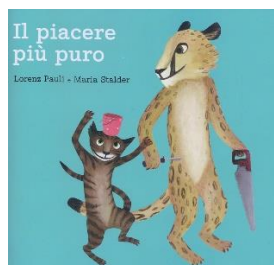
Il piacere più puro, Pixi Ciclo 1