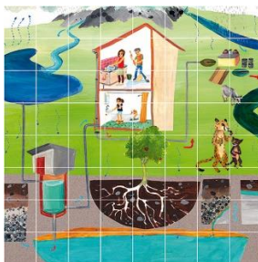
Il piacere più puro, Puzzle Ciclo 1