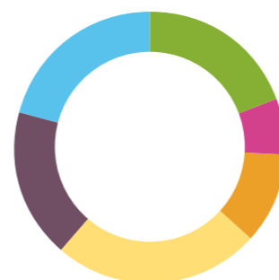
Dépenses d'exploitation en fonction des domaines