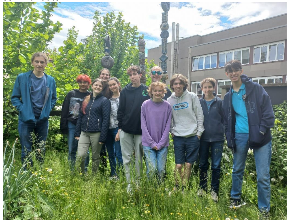
"L'Éco-Crew" à l'Ecole Internationale de Genève organise des actions écologiques.

rêve est que «Les écoles n'enseignent plus la conformité avec le passé, mais qu'elles permettent aux jeunes de construire un avenir inclusif, durable et pacifique dans leur propre communauté».