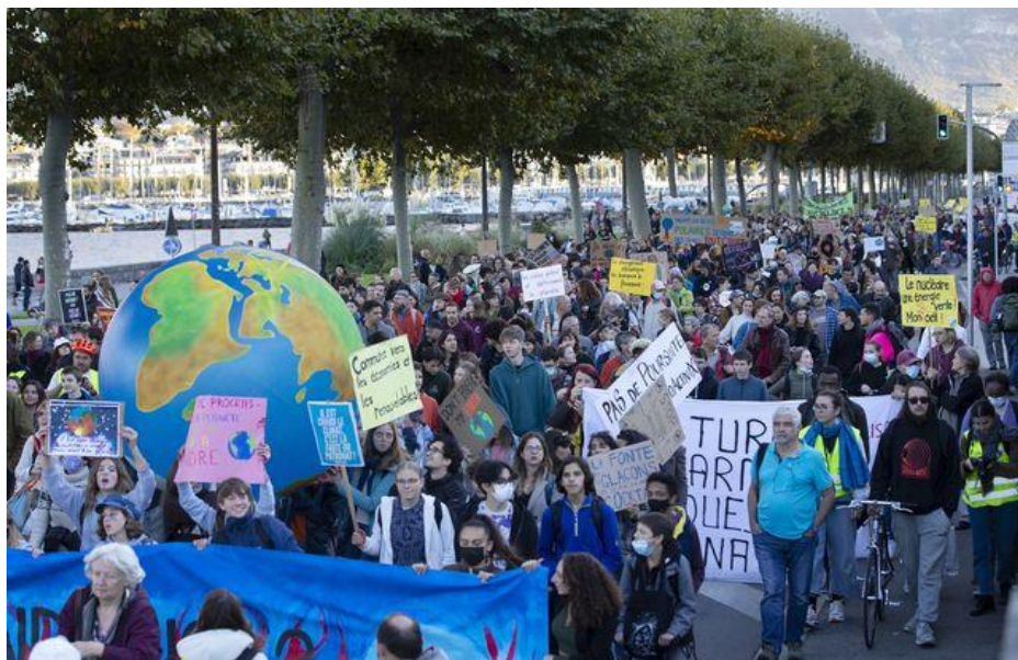
Le climat, une problématique centrale pour les jeunes et les adultes à Genève (RTS, 2021)