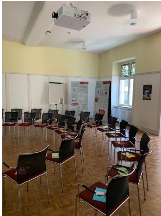
Fotos vom 10.5.2022, Glockenhof Zürich