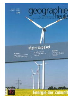
Energie der Zukunft Ab Zyklus 3