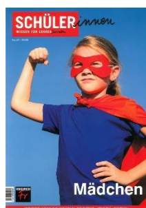
Mädelchen Alle Schulstufen