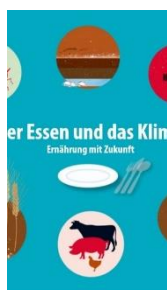
Unser Essen und das Klima Ab Zyklus 3