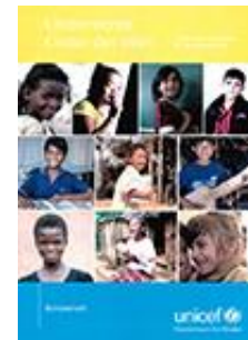
UNICEF-Schulpaket: Du hast Rechte 1. und 2. Zyklus