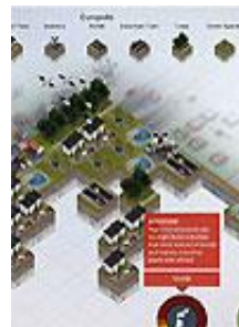
StadtklimaArchitekt ab 3. Zyklus