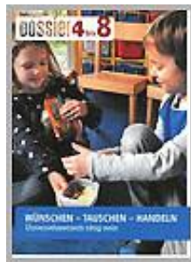
Wünschen - Tauschen - Handeln 1. Zyklus