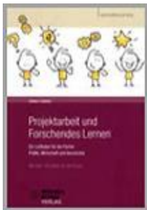
Projektarbeit und Forschendes Lernen ab 3. Zyklus