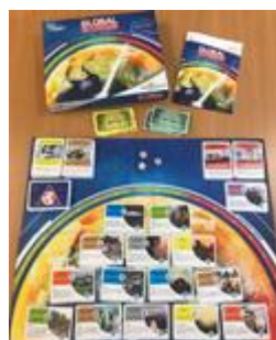
Global Warning Cycles 2 à 3