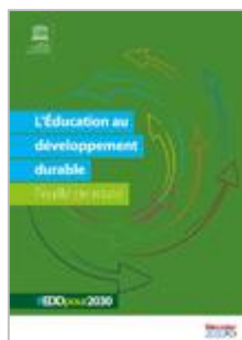
L'éducation au développement durable - Feuille de route Cycle 1 à sec. II