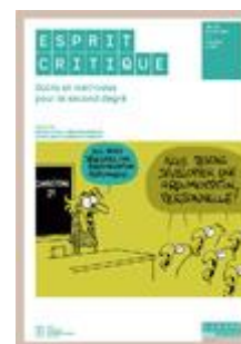
Esprit critique Secondaire II