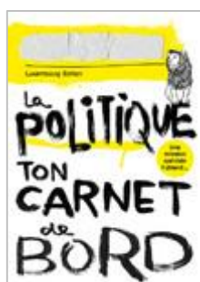
La politique : Ton carnet de bord Cycle 3 à sec. II