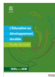
L'ÉDD : feuille de route | Outils Tous les cycles