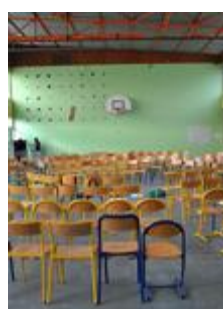
Jeu des chaises sur l'eau Cycle 3 à sec. II