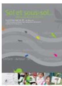
Sol et sous-sol... des questions à creuser Cycles 1 à 2