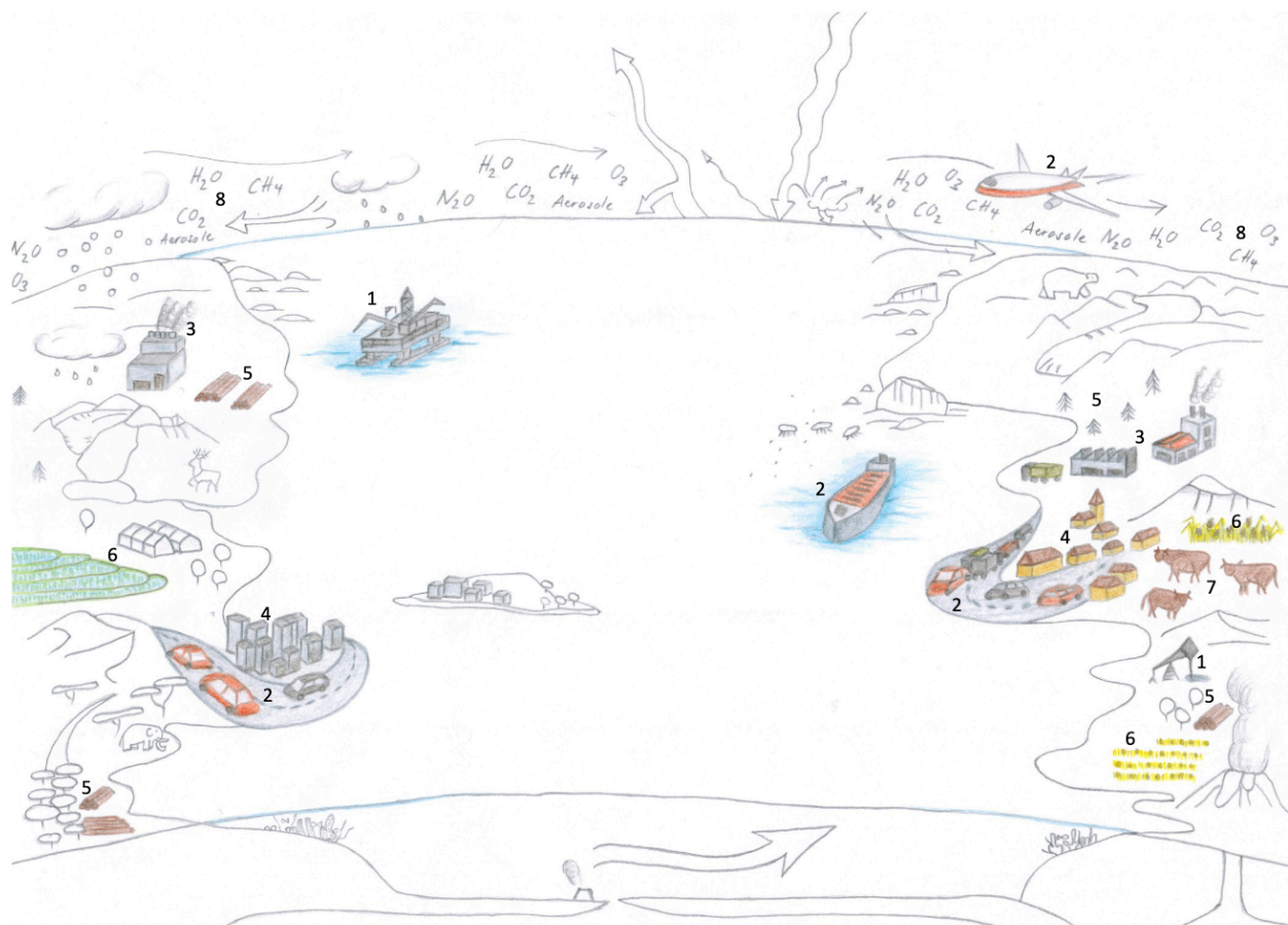
Fig. 1. Causes anthropiques du changement climatique. (croquis original projet CCESO II. Dessin: Michelle Walz).