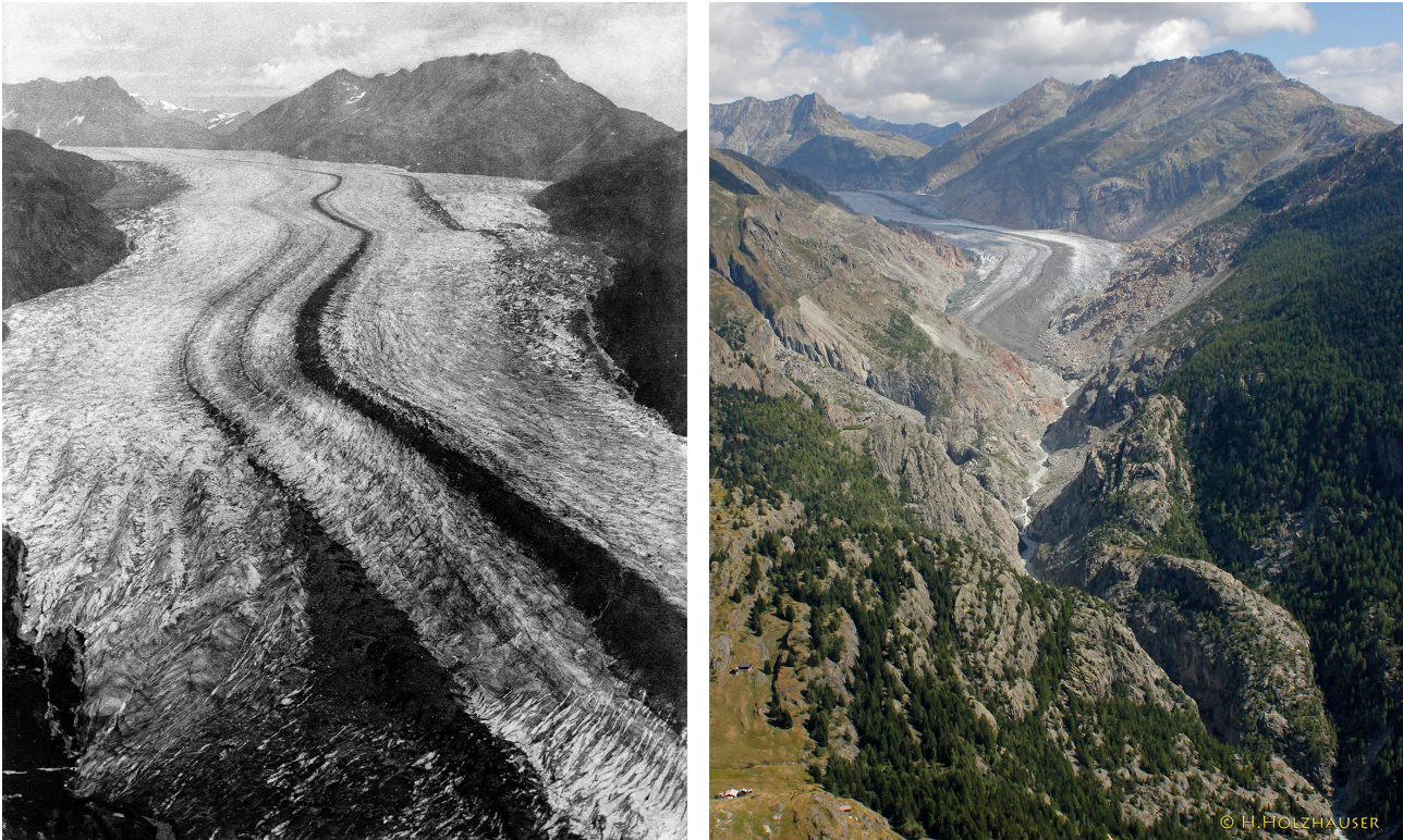
Fig. 2. Le glacier d'Aletsch en 1856 et de nos jours.

laves torrentielles). Les villages et les infrastructures des zones de montagne sont de ce fait exposés à des risques plus élevés. 13