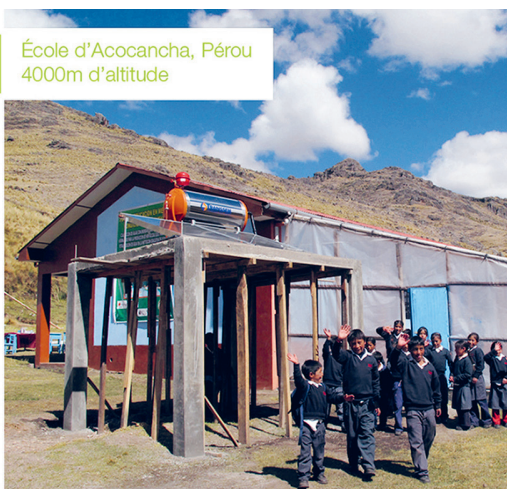
École d'Acocancha, Pérou 4000m d'altitude